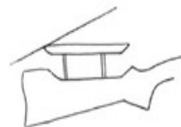
Stock with adjustable comb