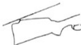
Monte Carlo stock